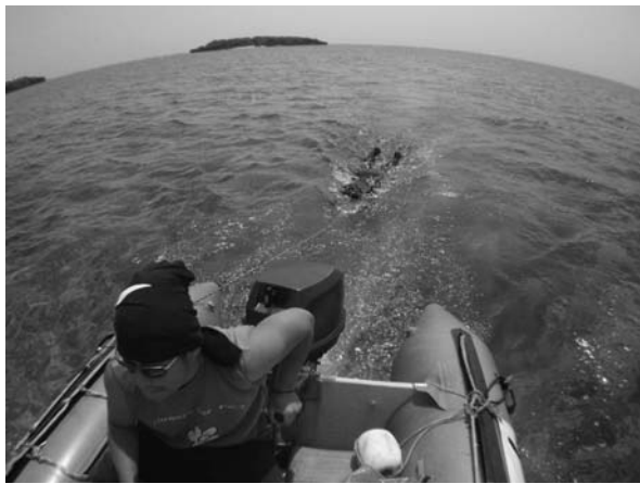
写真1 マンタ法による食跡調査