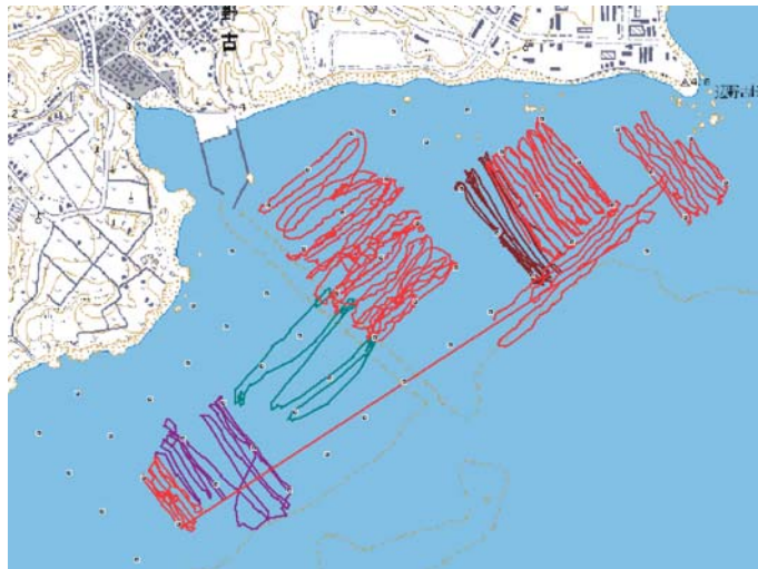
図2 食跡調査のトラック (2007年11月)