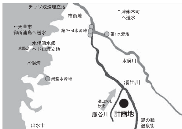
産廃処分場予定地位置図

IWD東亜熊本の産廃最終処分場建設計画がはじめて明らみに出たのは、2003年5月11日、IWDが木臼野地区で行った事業説明会においてだが、その年に18人が亡くなる土石流災害に見舞われた水俣では、産廃問