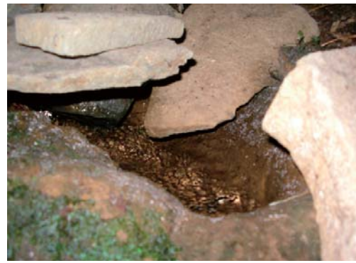
こんこんと湧き出る大森の湧水

水俣の山地は霧島火山西方にある肥薩火山区の約760万年～200万年前頃に活動した火山から噴出した溶岩や火砕流堆積物などからできている。約210万年前の火山の噴火によって流れ出た溶岩（大滝溶岩）におお