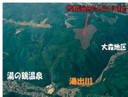
産廃処分場予定地写真