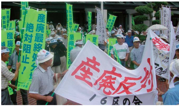
産廃阻止！水俣市民総決起大会（2006年6月25日）

題はまだ大きな話題にはならなかった。2004年3月、水俣市環境審議会での報告、5月、湯出地区での説明会、湯出住民の反対運動の立ち上げ、そして6月、「水俣の命と水を守る市民の会」（以下「水の会」）が結成されるに至って、私たち相思社もようやくこの問題を認識しはじめた。その間、2004年3月には、環境アセスメントの項目と方法を示す「方法書」が縦覧されていたが、私たちはそれが何を意味するのかさえ皆目理解できず、住民意見を述べる機会を逃してしまった。問題を表立たせまいとするIWD側の巧みな工作があったにせよ、市の広報に公告はされたわけであり、私たちは無関心という最も警戒すべき罠に陥り住民としての権利を放棄してしまっただけといえる。痛恨の極みである。