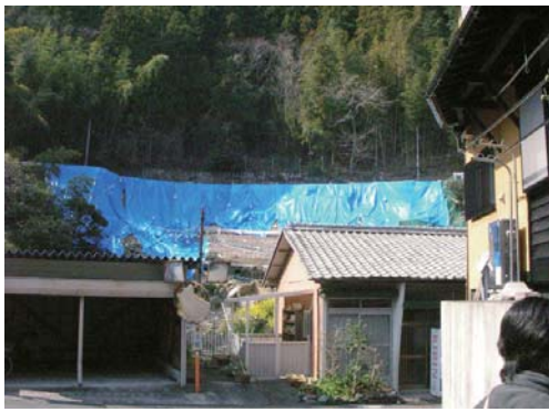
2006年7月の豪雨で崩れた湯出川沿い斜面

IWD 東亜熊本は湯出川沿いには崩れている場所はなかった、と主張しているが、実際に崩れている場所があり、専門家も馬尼田台地は基本的に崩壊地形であると指摘している。